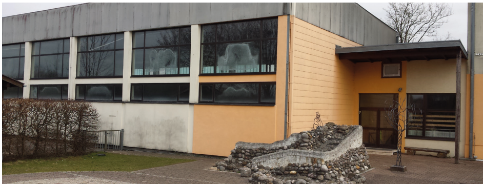
Blick vom Pausenhof auf den Volksschul-Turnsaal. Auch dieses Gebäude hat eindeutig die besseren Zeiten hinter sich.

Schon 2009 wurden von der Gemeinde die ersten Pläne für die Volksschulsanierung beim Land OÖ eingereicht. Dann wurde Stadl-Paura über Jahre hinweg immer wieder vertröstet. Die „rote“ Gemeinde wurde vom „schwarzen“ Land regelrecht abgeschasselt. Es wurden immer wieder Bestätigungen und neue Pläne gefordert.