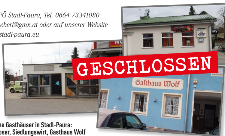
Geschlossene Gasthäuser in Stadl-Paura: Gasthaus Moser, Siedlungswirt, Gasthaus Wolf

ist Mitglied im Ausschuss für Umweltfragen, Energie, Sicherheit und örtliche Raumplanung und ist Kustos im Schifferverein Stadl-Paura.