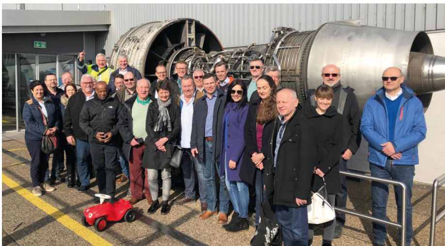
Unsere sehr internationale Gruppe am Flughafen Hannover

Am nächsten Tag, nach einem gemeinsamen Frühstück der Vertreter der Partnergemeinden, ging es zu einer sehr interessanten Flughafenführung, wobei uns auch ein Blick hinter die Kulissen gewährt wurde. Der niedersächsische Jagdclub lud die Delegation anschließend zum Mittagessen ein. Danach konnten wir uns beim Bogenschießen,