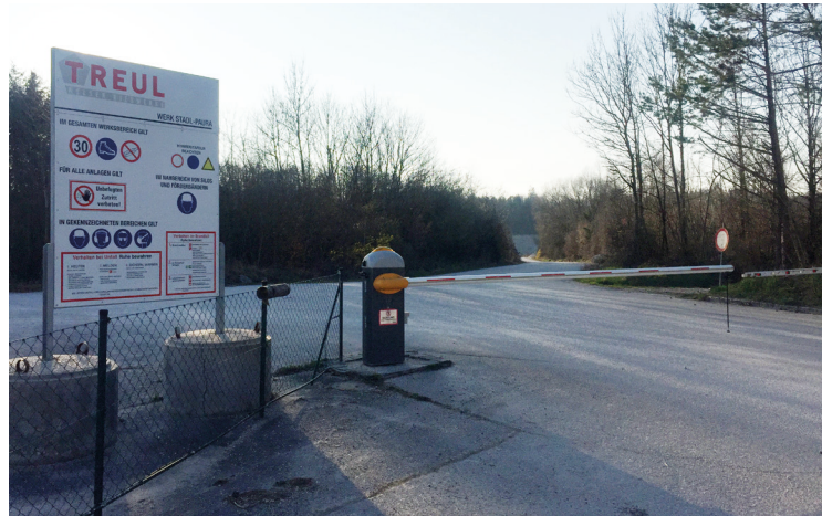
Einfahrt zum Schotterabbaubereich Treul

In der letzten Gemeinderatsitzung wurde der Verkauf eines gemeindeeigenen Waldgrundstücks, das direkt an die Schottergrube angrenzt, von uns verhindert. Aus strategischen Gründen sind wir gegen den Verkauf solcher Grundstücke, jedenfalls so lange, bis die Brücke über die Ager tatsächlich gebaut wird.