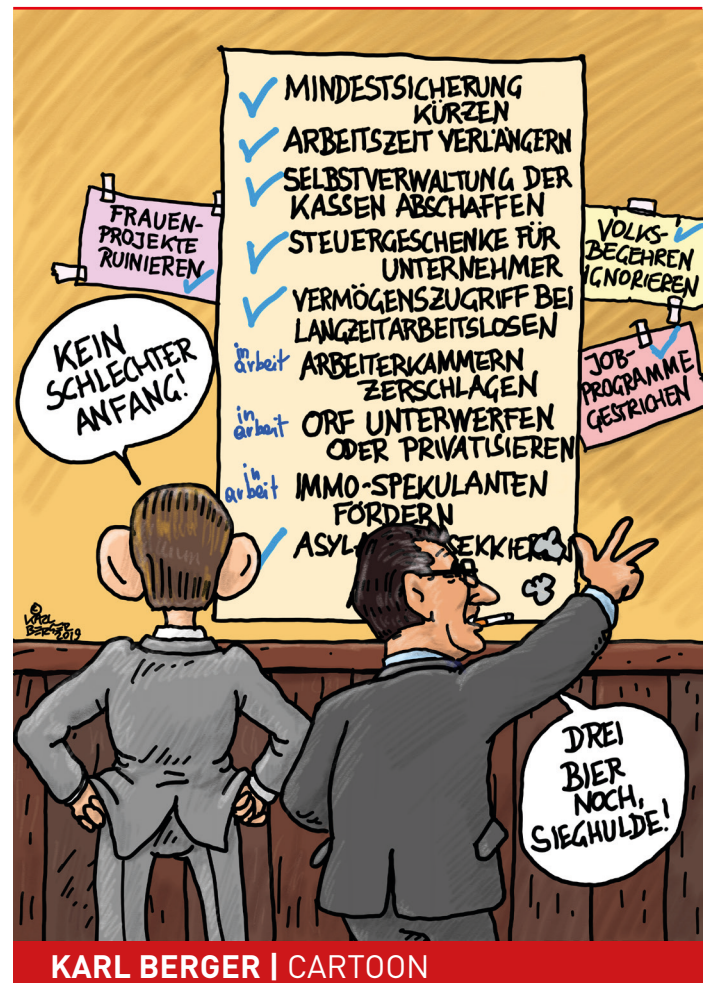
KARL BERGER | CARTOON

Da es in der türkis/blauen Regierung inzwischen normal ist, dass im Gesetzgebungsprozess nicht auf die Sozialpartner (Krankenkassen, Kammern) gehört wird, ist es nicht weiter verwunderlich, dass berechnete Einwendungen einfach ignoriert werden.